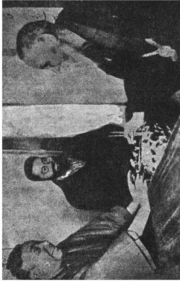
जापान में सन् १९२३ में मुद्रसिद्ध कालिकाश्री श्री रासबिहारा बोस और जापान के श्री तोयामा के साथ राजा महेन्द्रप्रताप ।