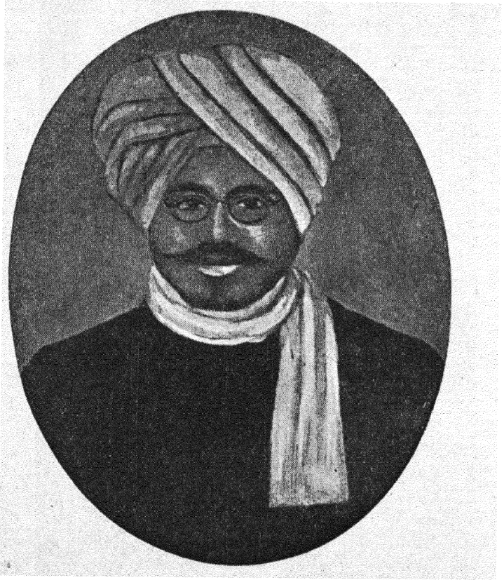
राजा महेन्द्रप्रतापसिंह (मुवायत्था के प्रारम्भिक दिनों के वेश में)